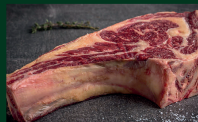
CHULETA DE VACA 75€/Kg