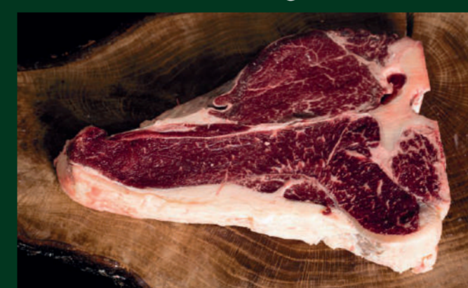
T-BONE DE VACA 75€/Kg

Contamos con carta de alérgenos a su disposición. Fotografías orientativas. IVA incluido. We have a letter of allergens at your disposal. Orientation photographs. VAT included.