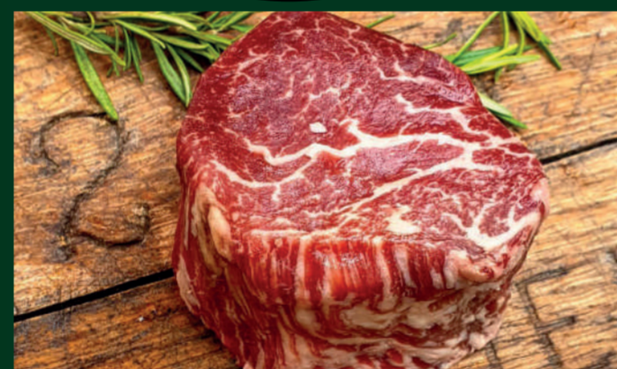
SOLOMILLO DE VACA 27€/ unidad