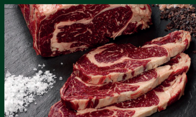
ENTRECOT DE VACA 25€/ unidad